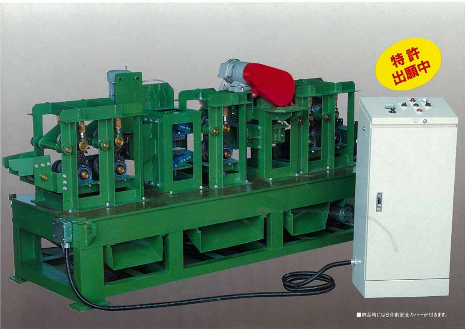
■納品時には6分割安全カバーが付きます。